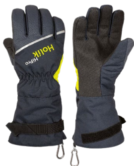
Maris Long PTFE