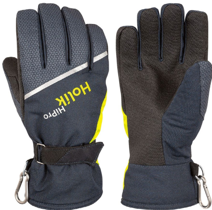
Maris Compact PTFE

Velmi odolné zásahové rukavice s membránou.